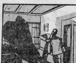
MILES DE SOLDADOS ALEMANES QUE VI-VÍAN EN HOLANDA COMO PAZIFICOS CIUDADANOS GUARDABAN UNIFORMES MILITARES HOLANDESES ENTRE SU ROPA.