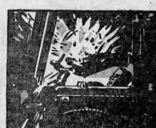
ENTRE TANTO, LOS SABOTEADORES ALEMANES CONSEGUIAN EMPLEOS EN LAS FÁBRICAS DE ARMAMENTOS EN DONDE A MENUDO OCURRÍAN ACCIDENTES "MISTERIOSOS".