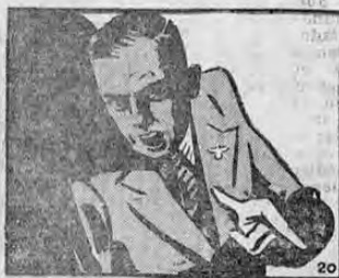
EN BERLÍN, ERNST BOHLE, EL ORGANIZADOR DE TODOS LOS ALEMANES EN EL EXTERIOR OÍÓ ORDENES A SUS AGENTES PARA QUE SE ROBARAN MILES DE UNIFORMES MILITARES HOLANDESES.